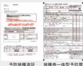
予防接種済証 接種券一体型予診票

接種券一体型予診票と予防接種済証は切り離さずにお持ちください。接種券一体型予診票は事前にボールペンで記入してください。