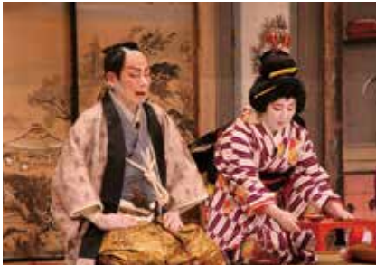
平成29年度定期公演「元禄忠臣蔵 南部坂雪の別れの場」