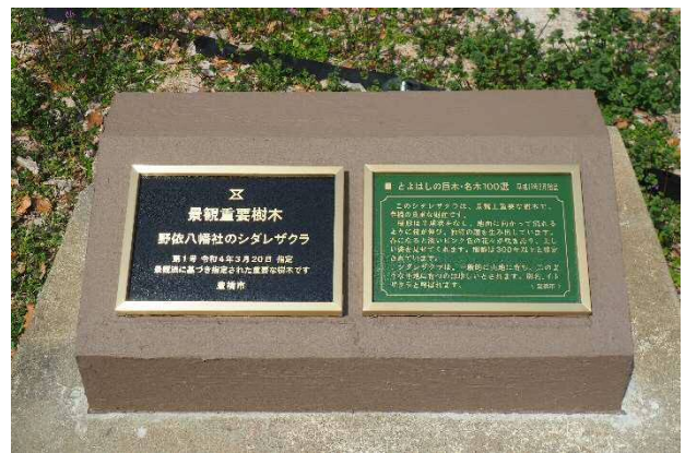
▲ 左：景観重要樹木の銘板（樹木の名称、指定番号、指定日を表示）