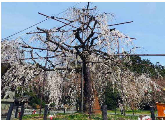
▲ 見頃を迎えたシダレザクラ