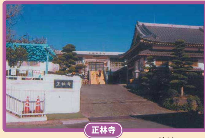
モダンな作りのお寺で、大きく伸びる「楠」が印象的♪隣に保育園があり、園児の元気な声が聞こえてきます。