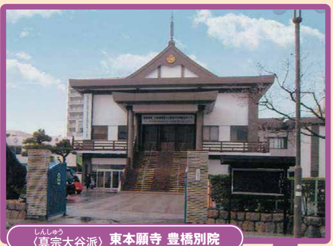
この「花園町」という地名は釈尊ご誕生の地「ルンビニ（ネパール）の花園」に由来とのこと。花園町に寺院や神社が多いのもうなづけますね。