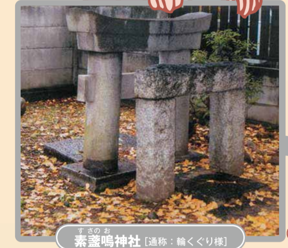
安産祈願の小さな可愛らしい鳥居があります♪