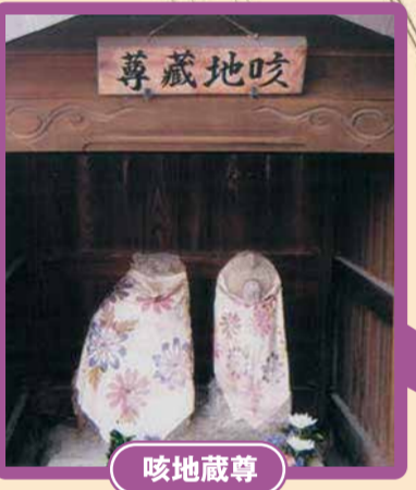
旅のお坊さんが「この石を祀(まつ)ってくれば、病気で難儀している者を救ってあげる」と言ったと伝えられています。