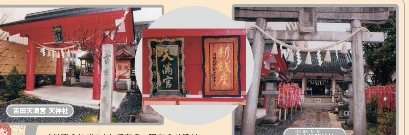
「学問の神様」として有名。現在の社殿は平成二十三年に新たに建立した姿です。