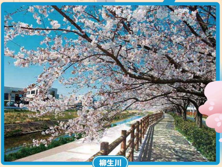
二級水系の本流である河川で、川辺には亀、野鳥の姿が見られます。春には川沿いの桜並木が見所!知る人ぞ知る名スポットです♪