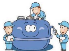
法定検査の受検を忘れず！