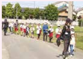
▲校区ウォーキング

自然に囲まれた牧歌的な環境の中で、のびのびと学べます。食農教育をはじめ、地域の方々との関わりを大切にしている教育活動を進めています。