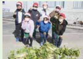
▲収穫に感謝する会 大根収穫