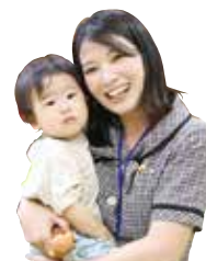
サブスク利用中の保護者の方