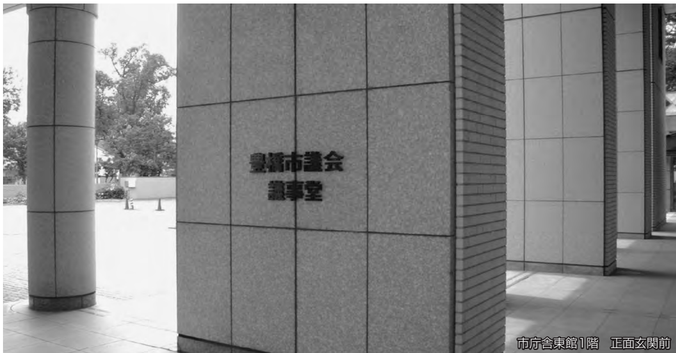
市庁舎東館1階 正面玄関前