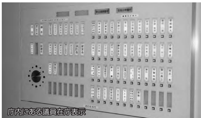
庁内にある議員在庁表示