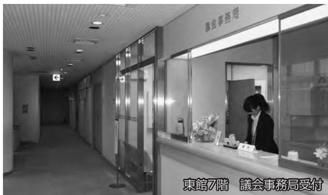
東館7階 議会事務局受付