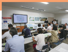
資源化センター視察の様子