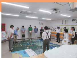
設案ダム工事事務所視察の様子