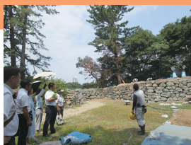
本丸北多門石垣修復現場視察の様子