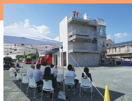
南消防署大清水出張所視察の様子