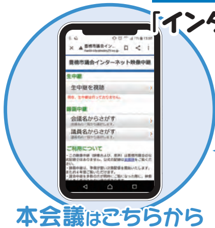
本会議はこちらから