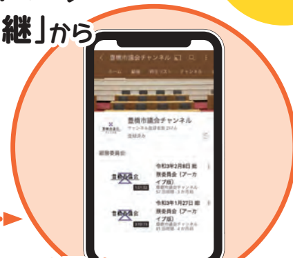
委員会はこちらから YouTube「豊橋市議会チャンネル」へ