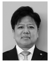
自由民主党豊橋市議団

問 新アリーナを建設中止にした場合における損害賠償請求の可能性と、市への影響をどのよ