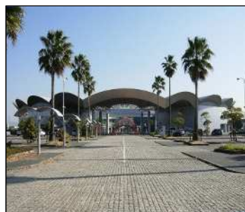
ライフポートとよはし