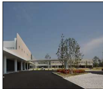
豊橋市保健所・保健センター