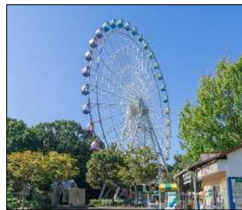
豊橋総合動植物公園